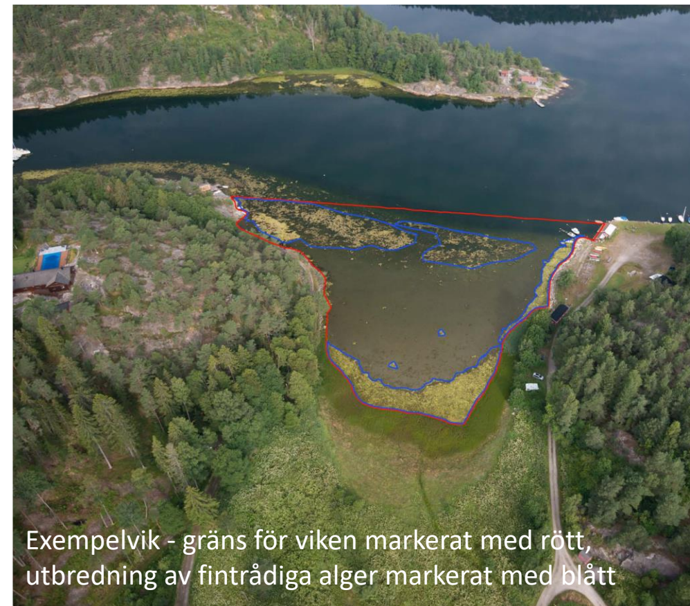
Exempelvik - gräns för viken markerat med rött, utbredning av fintrådiga alger markerat med blått