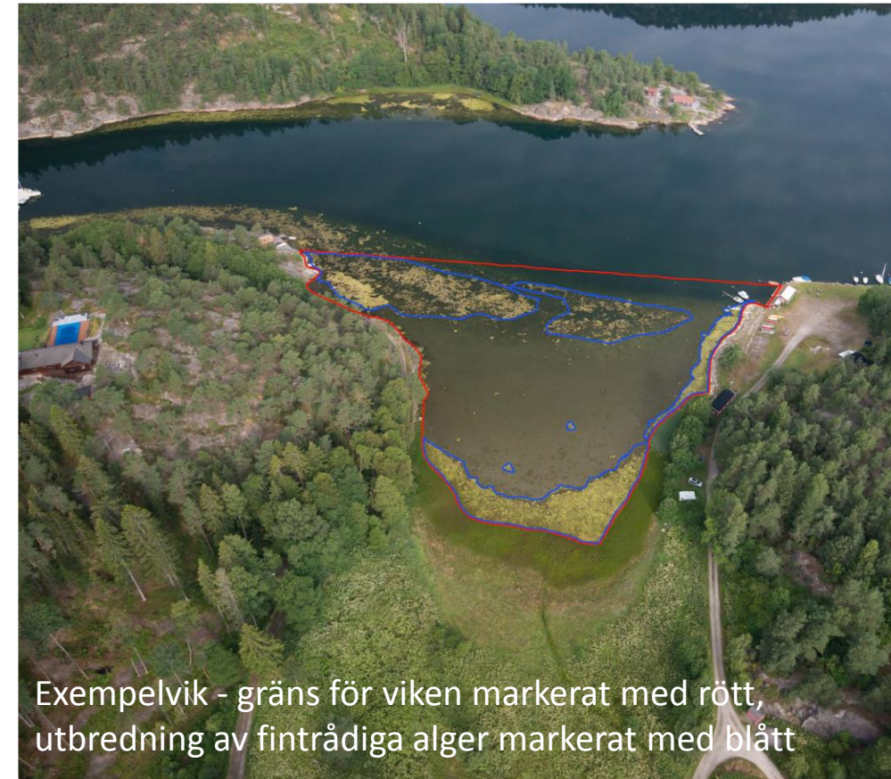
Exempelvik - gräns för viken markerat med rött, utbredning av fintrådiga alger markerat med blått